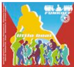
"Little Beat" 2003