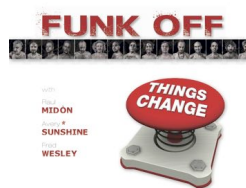
"Things Change" 2016