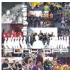
"Uh Yeah!" 2001