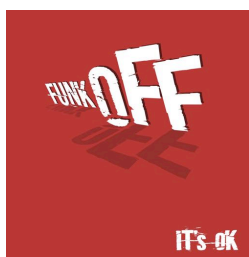
"It's Ok" 2018