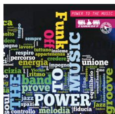
"Power to the Music" 2013