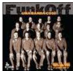
"Una banda così" 2010